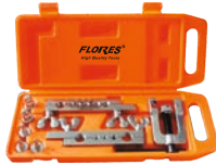
Trusa pentru bercuit tevi (WT 2055) 8buc./set