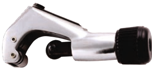
Rola mica pentru taiat teava