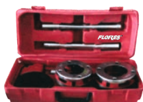
Trusa filliere pentru teava 2 capete filliere./set-4buc./cutie