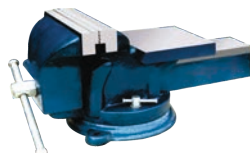
Menghina rotativa pentru banc