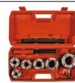
Trusa filliere pentru teava 6 capete filliere./set-8buc./cutie