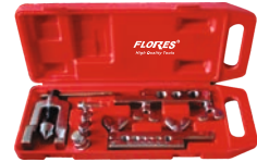
Trusa pentru bercuit tevi (CT 8011) 8buc./set