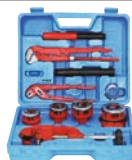
Trusa filliere pentru teava 4 capete filliere./set-10buc./cutie