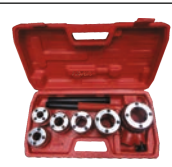
Trusa filliere pentru teava 6 capete filliere./set-8buc./cutie