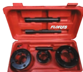
Trusa filliere pentru teava 3 capete filliere./set-5buc./cutie