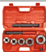
Trusa filliere pentru teava 5 capete filliere./set-7buc./cutie