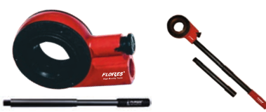
Cupla pentru capete filliera