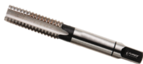
Tarod universal 1buc./set