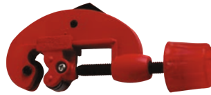
Rola mica pentru taiat teava