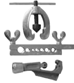
Trusa pentru bercuit tevi (WT 8017) 3buc./set