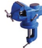
Mini menghina rotativa