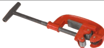
Rola mare pentru taiat teava