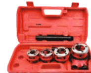
Trusa filliere pentru teava 4 capete filliere./set-6buc./cutie