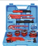
Trusa filliere pentru teava 6 capete filliere./set-12buc./cutie