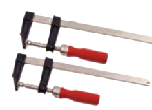
Menghina prindere lemn