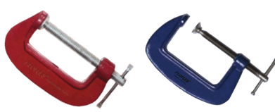
Menghina prindere lemn tip G