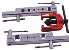
Trusa pentru bercuit tevi 3buc./set