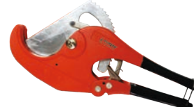
Cutter pentru pexal