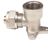
Cot cu talpa pentru teava pexal