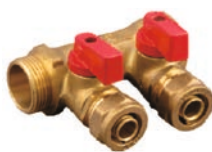
Distribuitoare pentru retea calorifere