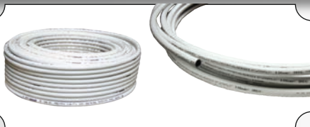
Teava pentru pexal