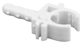
Clema pentru teava pexal cu diblu