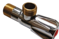
Robinet coltar din bronz