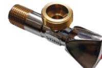
Robinet coltar din bronz