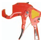
Cutter pentru pexal