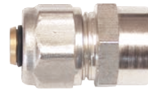
Mufa pentru teava pexal de FI