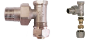
Robinet tur calorifer pentru pexal de 1/2