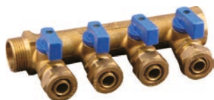
Distribuitoare pentru retea calorifere