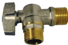
Robinet coltar din bronz