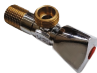
Robinet coltar din bronz