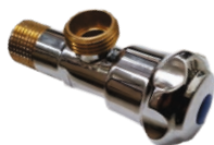
Robinet coltar din bronz