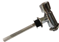
Robinet automat pentru pisoar