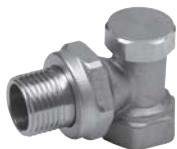
Robinet retur pentru calorifer