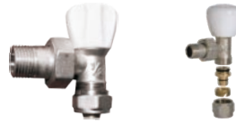
Robinet tur calorifer pentru pexal de 1/2