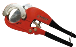
Cutter pentru pexal