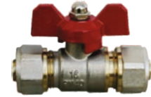
Robinet trecere din bronz pentru pexal (Piulita+Piulita)