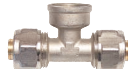
Teu pentru teava pexal