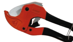
Cutter pentru pexal