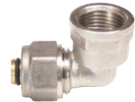
Cot pentru teava pexal (Piulița x FI)