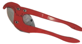
Cutter pexal cu manere lungi 60CM