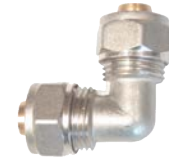
Cot pentru teava pexal