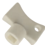
Chele pentru aerisit calorifer