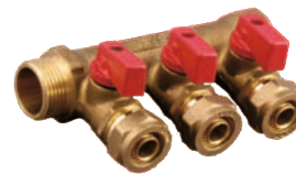
Distribuitoare pentru retea calorifere