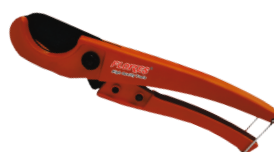
Cutter pentru pexal