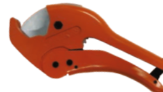
Cutter pentru teava pexal de 42MM (1"-5/8)