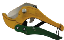
Cutter pentru teava pexal