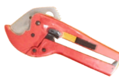
Cutter pentru pexal