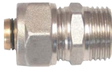
Mufa pentru teava pexal de FE