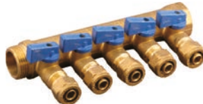
Distribuitoare pentru retea calorifere