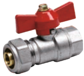
Robinet trecere din bronz pentru pexal