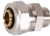
Mufa redusa pentru teava pexal Fe