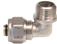
Cot pentru teava pexal (Piulița x Fe)