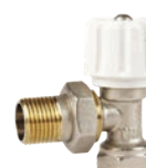
Robinet tur pentru calorifer de 1/2