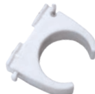
Clema pentru teava pexal