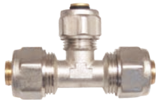
Teu pentru teava pexal (P+P+P)