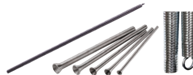
Arc pentru mulare teava pexal