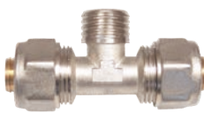
Teu pentru teava pexal