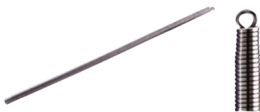
Arc pentru mulare teava pexal