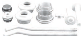
Suport pentru calorifer+piulite de 11buc./set