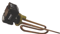
Rezistenta pentru boiler cu flansa