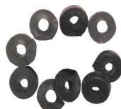
Garnituri pentru obtortain