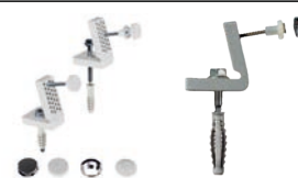
Suport prindere (WC+Chivveta) suspendate