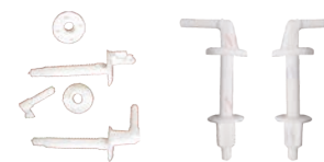
Surub din plastic pentru prindere capac WC