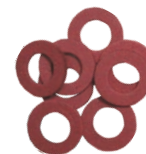
Garnituri din clingherit