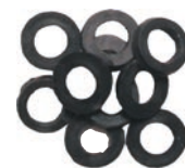
Garnituri pentru racord apa