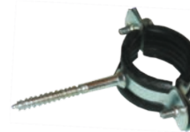
Bratari groase pentru teava