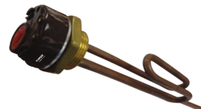
Rezistenta inclinata pentru boiler