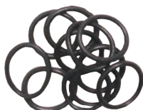
Garnituri inel pentru obtortain