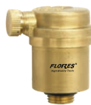
Supapa presiune automata