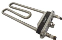
Rezistenta pentru masina spalata