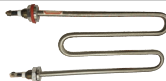
Rezistenta pentru masina spalata (ALBALUX) de 1900W