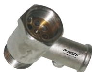
Supapa pentru boiler de 1/2