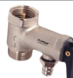
Supapa pentru boiler cu golire de 1/2