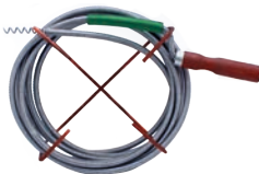
Sarpe desfundator pe rola