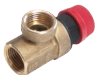
Supapa siguranta din bronz de 1/2-(FI+FE)