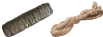
Canepa fuilor de 150GR./Sul