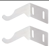
Suport reglabil pentru calorifer